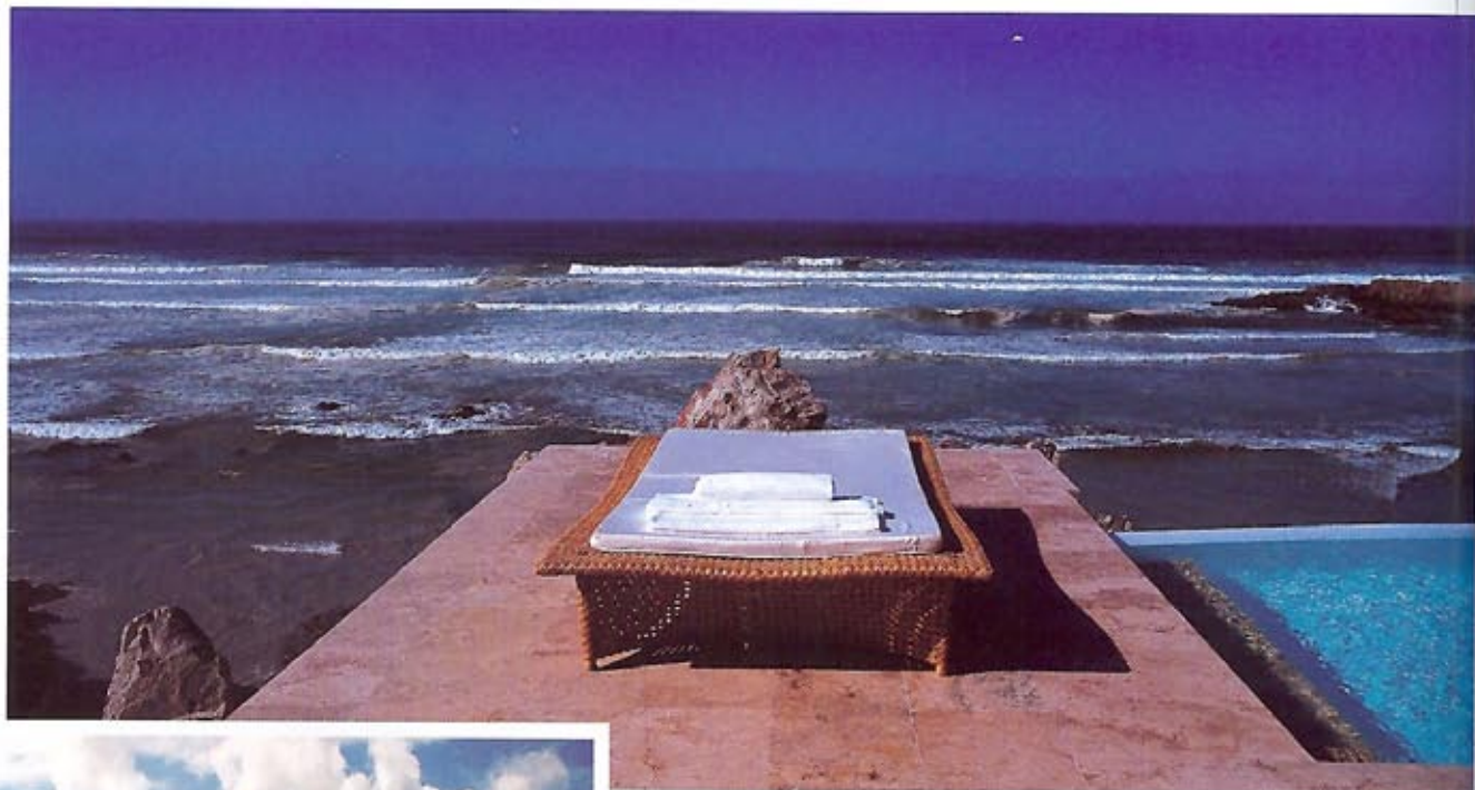
BIRKENHEAD HOUSE: Det enda som finns på "att göra-listan" är att njuta.

"DET ÄR MED MÅNGA MINNEN FÖR LIVET OCH EN STARK VILJA ATT SNART ÅTERVÄNDA SOM VI TILL SLUT MOTVILLIGT ÅTER STYR KOSAN HEM TILL SVERIGE."