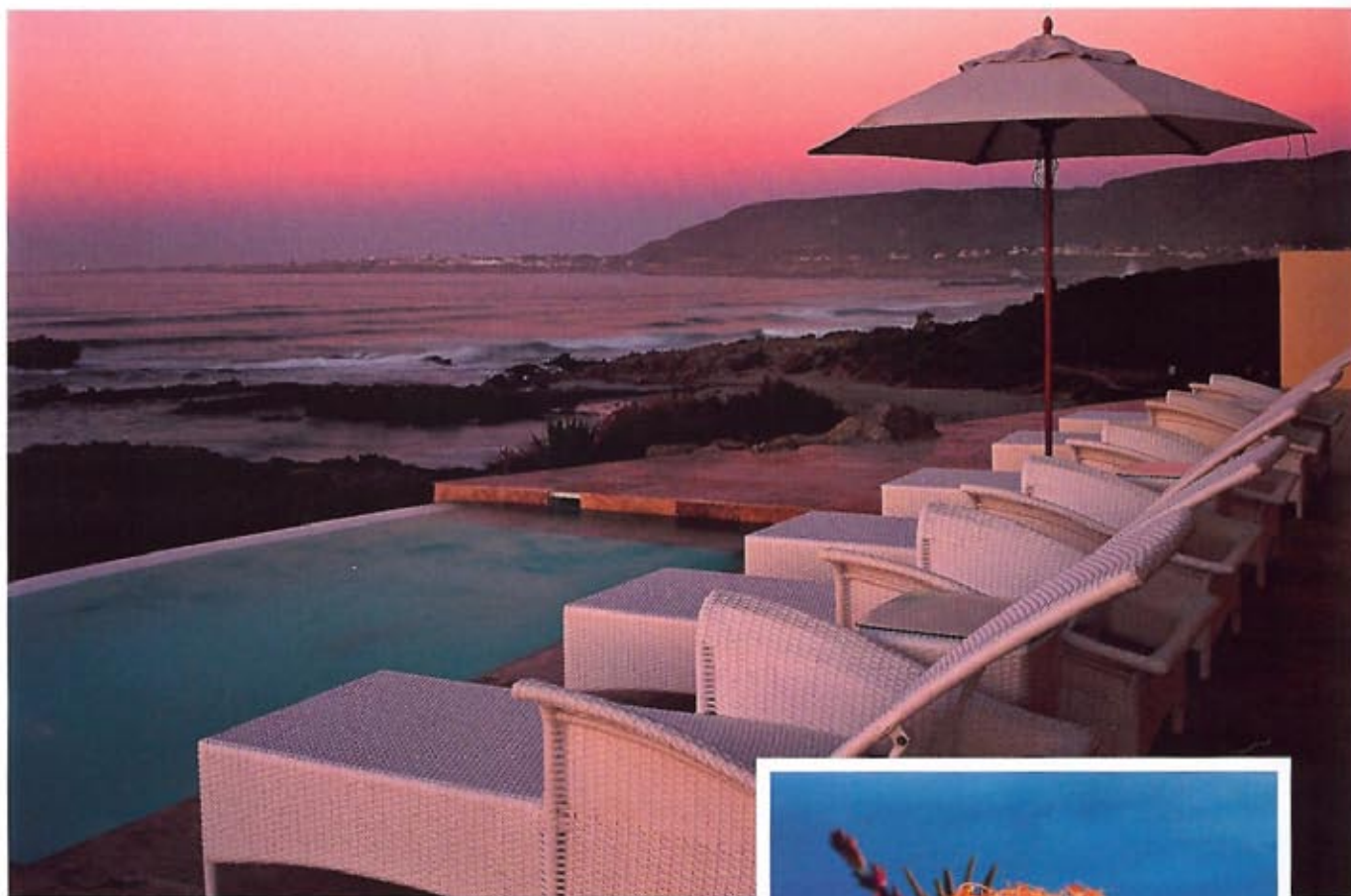
BIRKENHEAD HOUSE: Utsikten är omöjlig att se sig mätt på.

"VI BJUDS BLAND ANNAT PÅ EN FANTASTISKT VÄLSMAKANDE MIDDAG UNDER BAR HIMMEL, OMGIVNA AV ORÄKNELIGA LEVANDE LJUS."